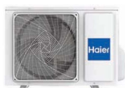
1:2 2U40S2SM1FA 2U50S2SM1FA